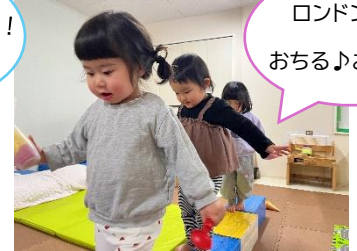
ロンドン橋が おちる♪おちる♪