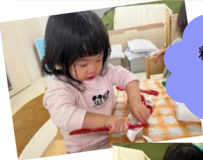
粘土やおえかきの 時間も大好き♪

2025年が始まりましたね。 連休明けは、子どもたちのペースでゆったりと過ごせるように 室内で好きな遊びをそれぞれ楽しみました！