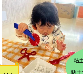
粘土ペラを使って粘土遊び★ 粘土がいろんな形になったね！