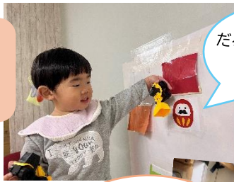
だるまさん見つけた！ あつぷが〜！