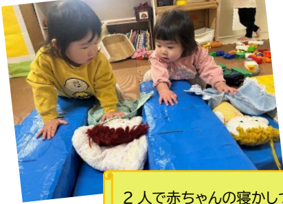
2人で赤ちゃんの寝かしつけ♪

初めて経験することにも積極的な子どもたち！ さまざまな伝統遊びに触れることができました。