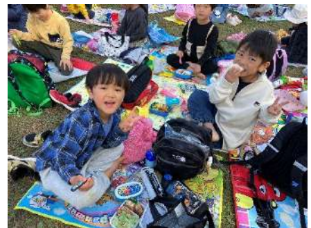
お弁当、美味しい。嬉しい。楽しい。「おいしい、お弁当ありがとう」