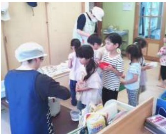
お弁当箱にご飯を詰めてから お弁当作りスタートです。 みんなワクワクしながら待っています。