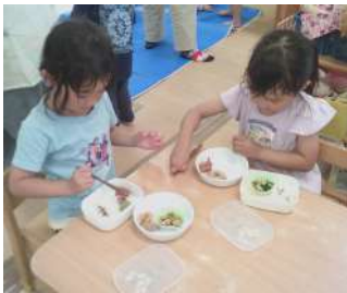
うずら組の子は、 お箸を上手に 使って作っています。