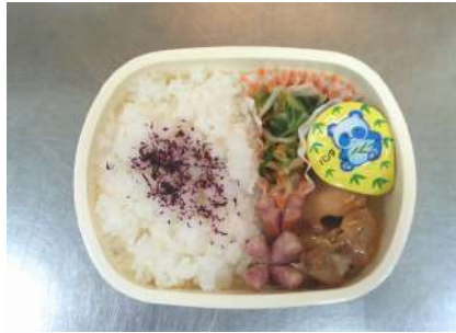
見本品 給食室で用意したものです。

5月14日(木)につばめ・うずら・ひよこ組の子に、お弁当作りをしてもらいました。「鶏の照り焼き・チンゲン菜の和え物・たこさんウィンナーソーセージ・ゼリー」を自分でお弁当箱に詰めて、お友だちと一緒に美味しく頂きました。ひよこ組の子は、初めはドキドキしながら作っていましたが、お弁当が出来上がると「出来たよ！」と嬉しそうに見せてくれました。天気も快晴でお弁当日和の日でした。みんな園庭や園内でお友だちと食べながら、「おいしいね！」や「またやりたい」と大好評でした。普段、食が進まないという子も、この日はいつもと違う給食時間で、楽しそうに食べておかわりをしてくれる子もいました。