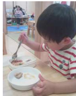
ひよこ組の子は、 スプーンを使って 楽しく作っていました。