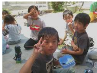
つばめ組の子たちです。 仲良く食べていました。