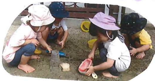
スコップでしっかりかためるよ

• 外でも過ごしやすい気温になり、朝や夕方、園庭に出ることが多くなりました。 とろんとあそびをして、石の感触を味わったり、友達と一緒に入スコップで穴を掘ったりなどそれぞれで楽しむ姿があります。