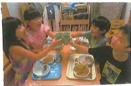
とっても美味しかった。