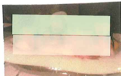
泡風呂に入りました。