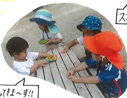
おいしいごはんもつまへす!!