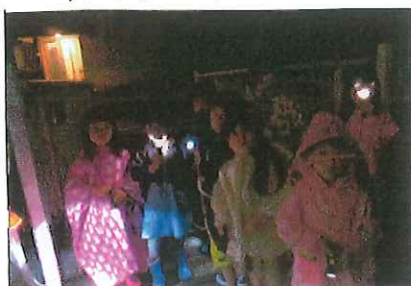
少し怖かった夜の散歩。 → 別の日に確認、何ともなかった!