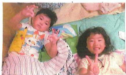
もちろんお泊まり。