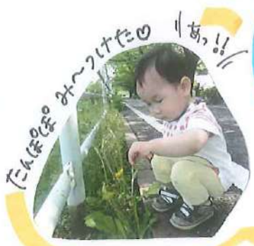
たんぼのぼもみつけたの あっ!!

先月はお散歩や公園に行き、部屋ではボールプールやコンビカーを出して遊んだり、粘土をしたりました♪見覚えのあるもも組さんは声を掛けると「やろー！」と準備を手伝ってくれ、初めて見るお友達は「何かおもしろそう♡」と感じて近づいて来てくれました。日々の生活に慣れたス、新しい遊びにも興味を持って見て触れて感じて楽しんでいけるようにサポートしていきますね。