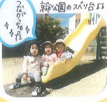
新公園のスリ台♪ ふんわり滑った たのしみ