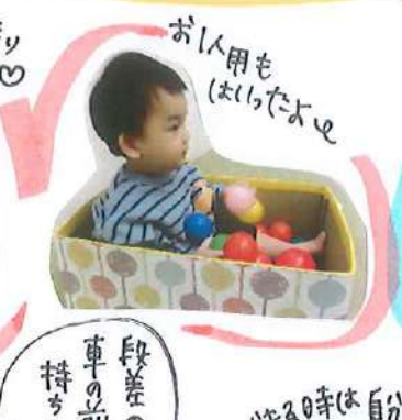
お人形もはいたよ