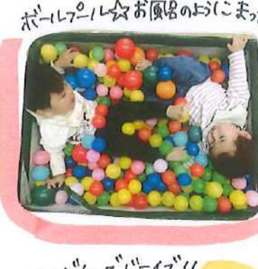
ボールプール☆お風呂のおにまわりの