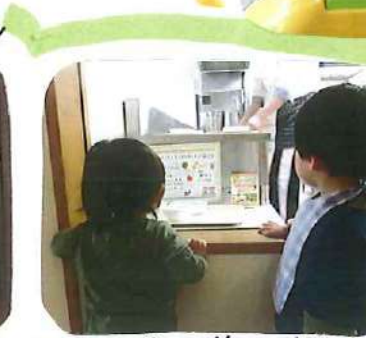
この後、一旦部屋に戻って.