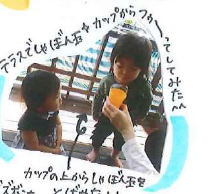
テラスではぼんぼりカッパからついでしてみたよ