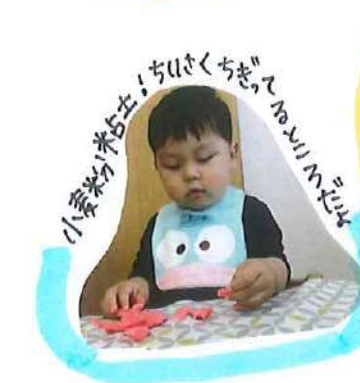
小麦粉粘土!ちびくちをいっしょにね