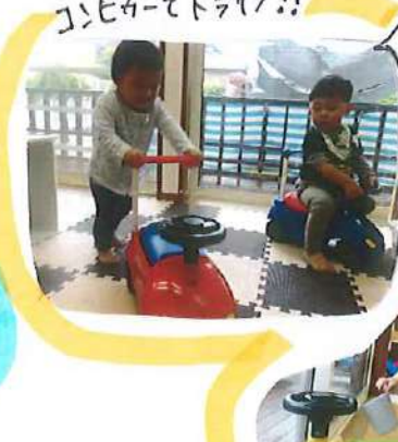
コンビカーでドライブ!!