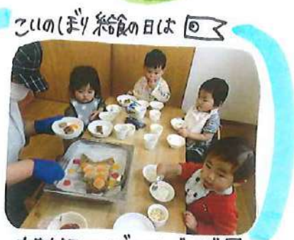
このほり給食の日は