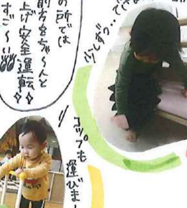
段差の所では車の前方をちゃんと持ち上げ安全運転ですごく上手!