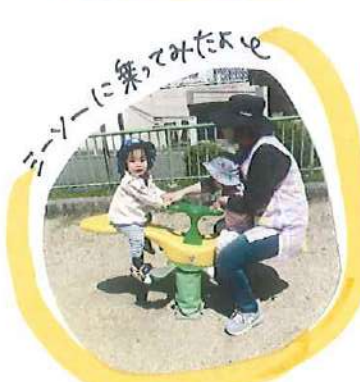
シーソーに乗ってみたよ