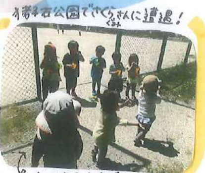
新公園でたくさんに遊ばせ!