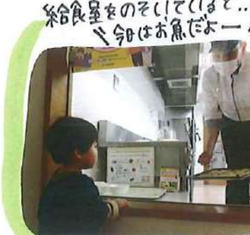
給食室をのぞいていると..今はお魚だよ!!