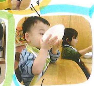
エプロンを着け、お友達が言葉を再び見学のときやはお腹が空いてきちゃったおです