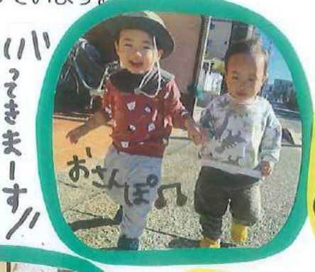
いっしょに歩こう