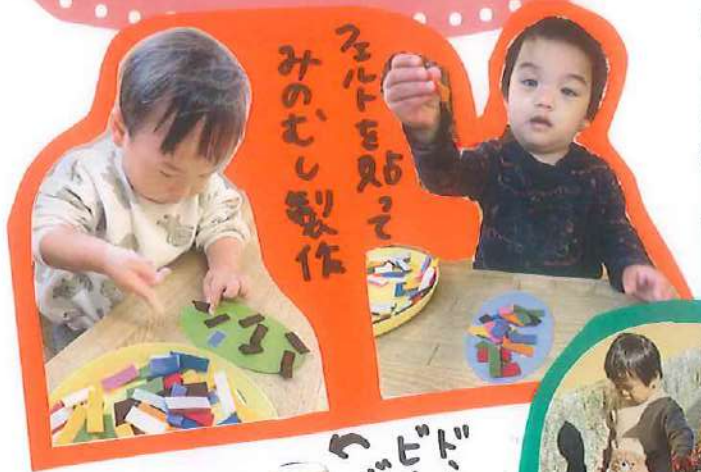
フェルトを貼って みのむし製作

最近では手を繋いで歩けるようになったこどもたちも増え、カートだけでなく自分の足で歩く楽しさを感じる機会も増えています。今月も体調に気を配りながらこどもたちと冬ならではの楽しみや発見ができたらと思っています。