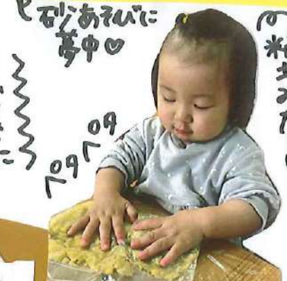
粘土あそびに 集中