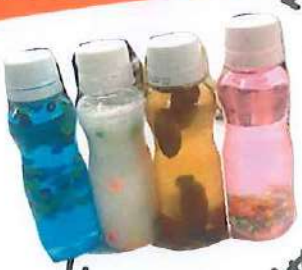
ドリンクリヤ ビリスを入れた ボトルも人気