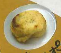
スイートポテトに したんだよ