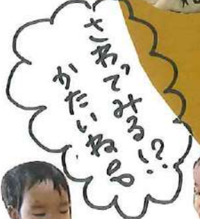
大きくなって かたいな