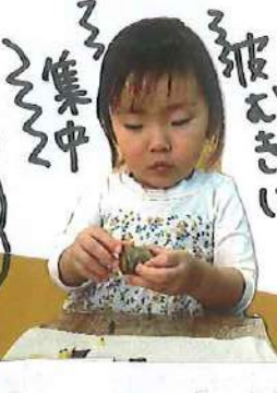
集中 食べることに 集中