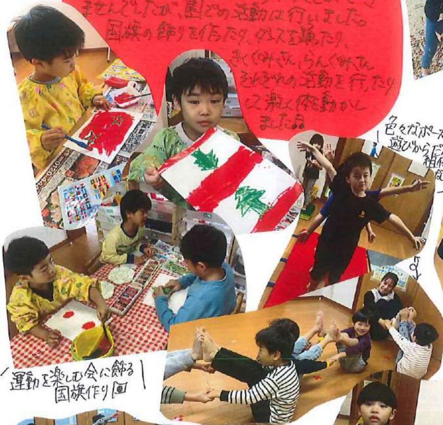
運動を楽しむ会に飾る 国旗作り回