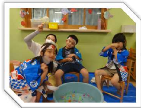
お客さんいらっしゃい😊

9月は涼くなった際には、公園に行ったり運動会ごっこをして身体を沢山動かし、楽しみた いと思います。