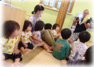
みんな大好きウォーレン先

春のお散歩ではたくさんの草花や虫を見つけていました。秋のお散歩でも色々な発見をしてくれるのが今からとても楽しみです。