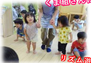
くま組さんにお邪魔します～