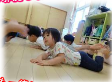
リズム遊びも一緒にした