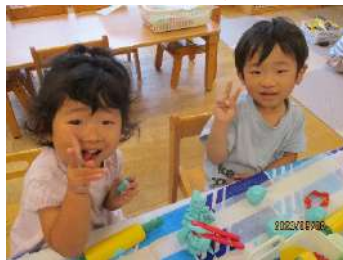
粘土 上達中・・・ イエーイ👏