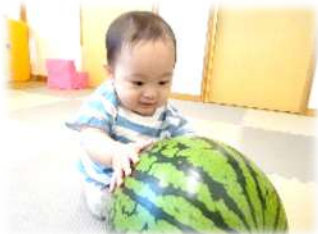
ひよこさん叩いてぺちぺち