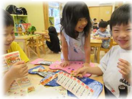
夏まつり製作の一場面♪

夏の大きなイベントは終わりましたが、くま組の子どもたちの楽しみは続きます。9月は年長さんのお泊り会が行われたり、気温が落ち着きお散歩が始まると運動を楽しむ会に向けて、競技ごっこが始まります。季節の変わり目なので体調の変化に気を付けながら、秋のイベントを元気に楽しめるように外遊びなどで体づくりをしていきたいと思っています。