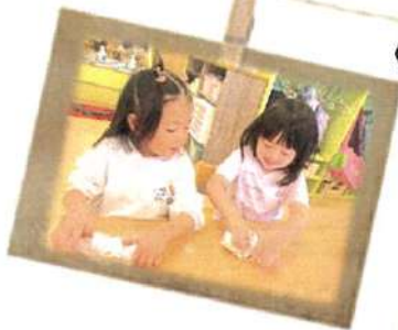
アルミホイルで さつまいもをくるくるっと包んで下準備