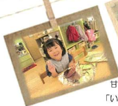
甘くなった焼き芋はおやつで 「いただきます」