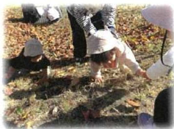
斜面もどんどん登るよ!

今後も一緒に元気に過ごし、新しい一年を笑顔で迎えられたらと思いますので、引き続き宜しくお願いいたします。