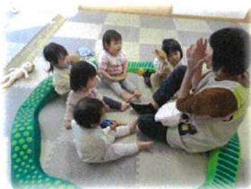
なんだか集まって楽しそう!