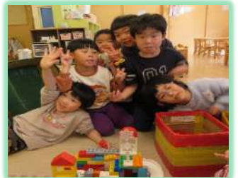
↑作ったブロックの写真を撮ろうとすると、たくさんの年中、年長さんが映り込んできます笑