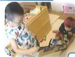
スライダーを作って車遊び