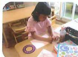
くるりんグラフ丸い枠を使って線模様を描きます