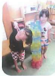
コップを使った遊び