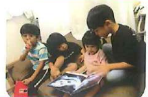
絵本コーナーできく組の子と