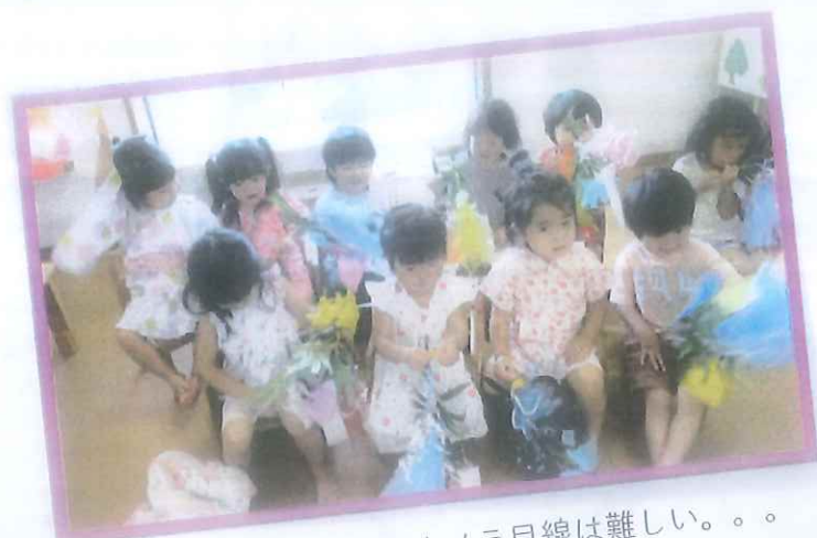
全員カメラ目線は難しい。。。

毎日、気温の高い日が続いていますね。 熱が出てしまったり、鼻水や咳の出ている子も いましたが、うめ組さんは元気いっぱいです。 先日はクラス懇談会にご参加いただき、ありが とうございました。限られた時間でしたが、 園での様子を見ていただき、またおうちの 様子も知ることができました。懇談会以外でも いろいろお話できたらと思っていますので、 気軽にお声かけくださいね。