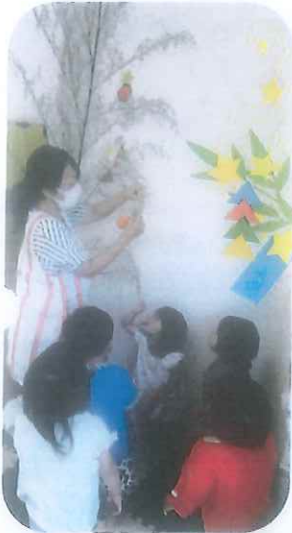
たなばたの笹飾りってなあに？

8月もたくさん遊んで、いっぱい食べて、そしてしっかりと休息を取りながら、体の変化に気をつけてみんなで元気に過ごしていきたいと思います。