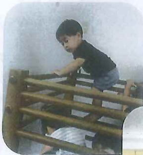
てっぺんまで上れたよ。