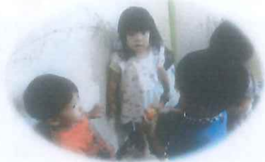
お星さまのポテトを食べたよ。