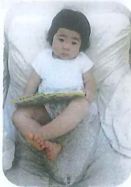
新しい図鑑を見たり、プルバックの車で遊んでいるよ。