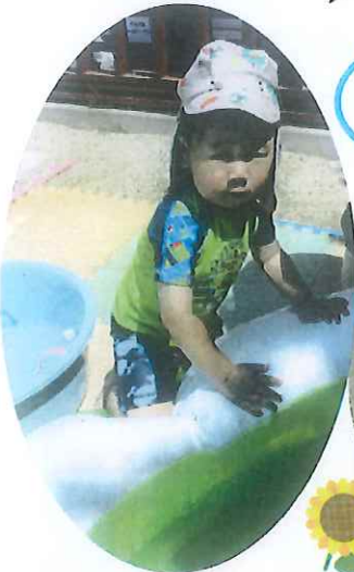
プールはちょっぴりドキドキするけど、お水は気持ちいいよ～。