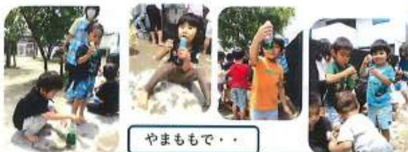
やまももで・・・

色水を作って遊びました。食紅を使って5色の色を用意。どの色とどの色を混ぜたらいいかな。こんな色ができたよと色の变化を楽しんでいました。ジュース屋さん開かれたりしていました。