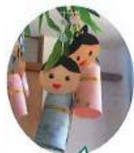
素敵ば飾りがで きました!

6月は、指スタンプをしました。スタンプ台も色々な色を用意し、「どれにする?」と聞くと自分で好きな色に手を伸ばし、にっこり!自分で選んだ色で紙にペタペタスタンプしました。子どもたちが大好きな“大きなたいこ”の手遊びうたを歌いながら楽しく遊ぶことができました。