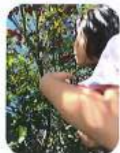
らんぐみとさくらぐみ一緒に遊ぶことも増えてきました。