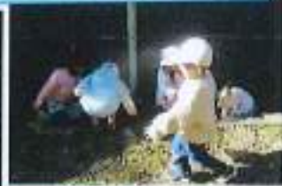
落ち葉もいっぱいあったよ！集めて雨みたいに降らせてみよう♪