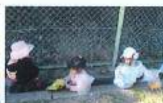
側溝に落ちているどんぐりも見逃さないぞ！