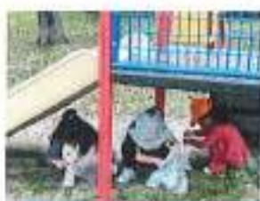
どんぐり拾いに夢中で誰もカメラを見てくれない…

公園や緑道へ、秋を探しに行きました。一人ひとりビニール袋を持って、どんぐりやいろいろな色の落ち葉を拾いました。「こっちのどんぐりは丸いけど、あっちのどんぐりは細長いね」「そっちのどんぐりは大きいね」など形や大きさの違いを見つけっていました。黙々と拾い続け、気づけば袋はいっぱいになっていました！また、松ぼっくりも拾ったので、クリスマスツリーに変身させてみようと思います。クリスマスツリーを作る様子は、来月紹介しますね♪