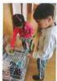
うさぎのももちゃんのお世話に きてくれる、さくら組さん