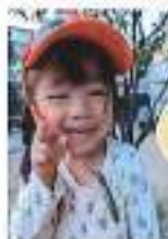
カマキリさんと仲よし♡