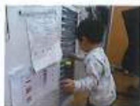
探索している、もも組さん

～今回は事務所の日常をお届けします！～（事務所には色々なお客様が訪ねてきますヨ）