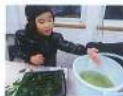
メダカにえさをあげてくれる、らん組さん