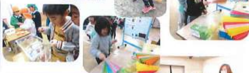
どんぐりや松ぼっくりを使ったゲームに参加

正保小学校との交流会に参加しました。1年生の子が作ってくれたゲームを楽しみ、港北幼稚園、小学1年生、リーグ正保保育園の子みんなでじゃんけん列車も楽しみました。今年は学校の中も少し探検させてもらえました。給食のいい匂い。勉強しているお兄ちゃん、お姉ちゃん。校庭も探検。体育の授業をしていた5年生の子たちがみんなと遊びたいと言ってくれ、遊具で遊んでくれました。学校ってこんなところなんだと就学への期待が膨らんだらいいなと思います。