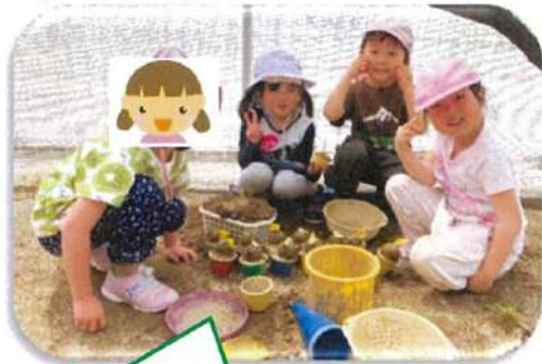
アイスクリーム屋さんです！