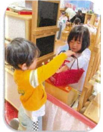
お店屋さんごっこ