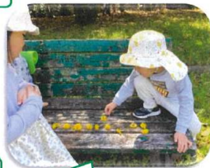
こちらはお花屋さんです