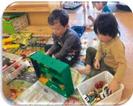
トミカのミニカー遊び