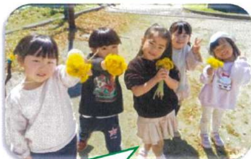
たんぼぼの花束かわいいでしょ！