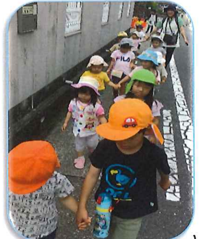
ほし組さんのお兄ちゃんお姉ちゃん たちと一緒に手をたないで散歩