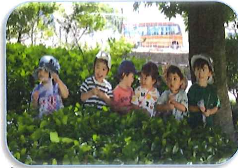
鬼ごっこなしかかな〜と 隠れている子どもたち。