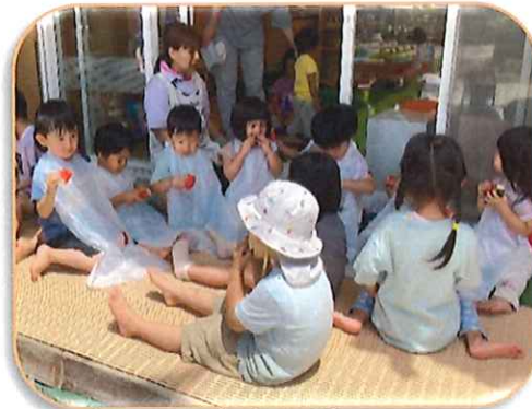
ほし組さんがゆたす力を テラスではくはく 甘くて美味しいな〜