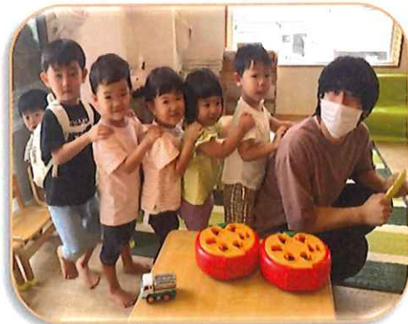
みんなで行こう。 "出発進行ー!!"