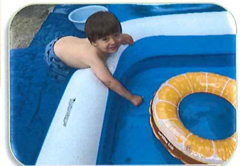
お水 冷めたて 気持ちいい〜!!