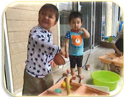
さくらぐみのお飯だちと 水あそび!!