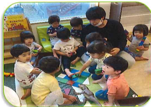
みんなで一緒に遊ぶの たのいな〜!!