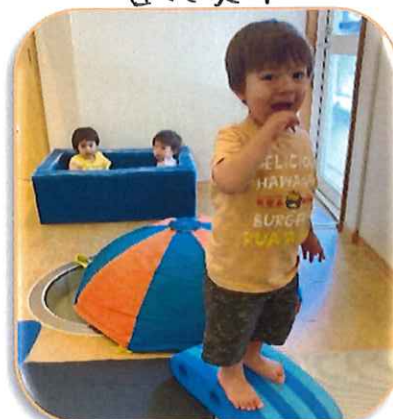
身体を動かして遊ぶの 大好き!!