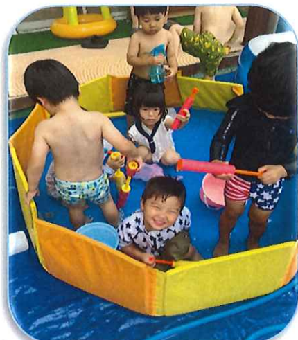
8月もみんなで水遊びを楽しんで いきたいと思ひます!!