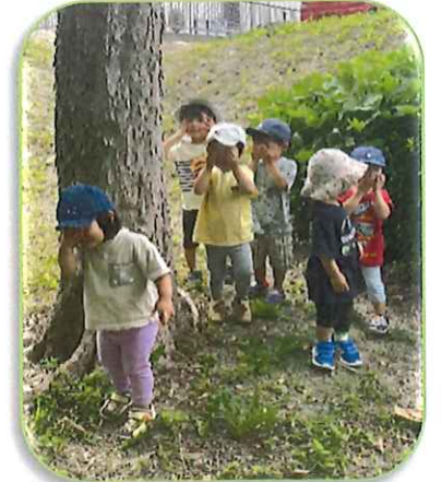
1.2.3...10 もういいかい!!と かかはんぼ。