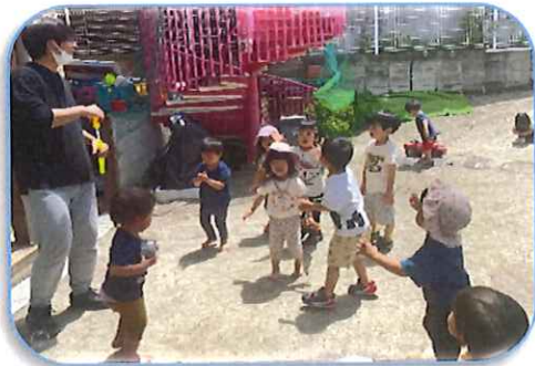
まてまて〜としほん玉も 運りかする子どもたち。