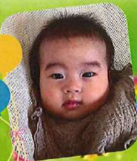
ミルク沢山飲めるようになったよ