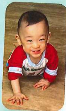
いろいろな所に 大移動!